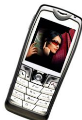
1 FORFAIT 2 heures / mois COMMUNICATIONS (Fixes, portables, dégroupés)