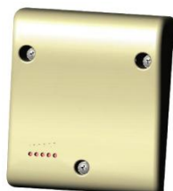
1 BLOC GSM DE TRANSMISSION