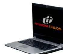
LA GESTION A DISTANCE ILLIMITEE